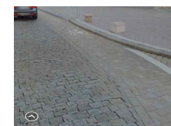
VELKÁ KOSTKA; š. = 16cm, řazení do cyklopruhu