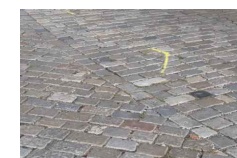
"BĚHOUN" – VELKÁ KOSTKA; š. = 16–20cm, dl. 16cm