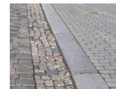
KAMENNÝ OBRUBNÍK OP2